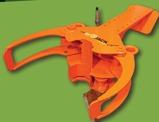
Bras de couplage